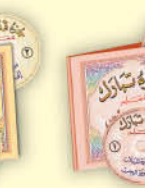
جزء تبارك (معلم) سي دي صوت فقط