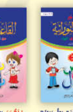
رحلة مع القاعدة النورانية من الألف إلى التاء (الجزء الثالث)