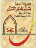
كتاب الطريقة العملية لتعلم وتعليم القرآن