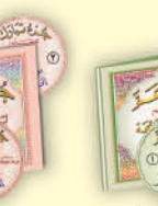
جزء عمّ (معلم) سي دي صوت فقط