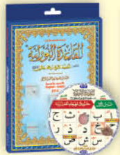
برنامج القاعدة النورانية بالصوت والصورة English / Arabic

القلم المعلم لتعليم القاعدة النورانية وجزء عم و تبارك وقدمع للمبتدئين