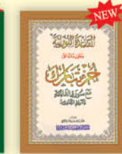
القاعدة النورانية وتطبيقها على جزء تبارك مع سورة الفاتحة تعليم المبتدئين