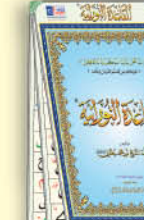
وسيلة تعليمية مكرة