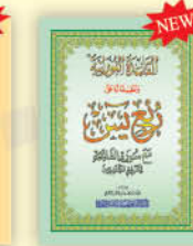
القاعدة النورانية وتطبيقها على ربع يس مع سورة الفاتحة تعليم المبتدئين