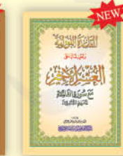
القاعدة النورانية وتطبيقها على العشر الأخرى مع سورة الفاتحة تعليم المبتدئين