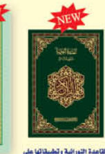
القاعدة النورانية وتطبيقها على القرآن الكريم تعليم المبتدئين A5