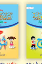
رحلة مع القاعدة النورانية من الألف إلى التاء (الجزء الأول)