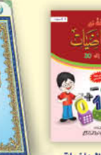
رحلة مع الرياضيات من 1 إلى 30