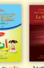
كتاب الطريقة العملية لتعلم وتعليم القرآن باللغة الفرنسية