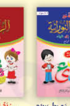
رحلة مع القاعدة النورانية من الألف إلى التاء (الجزء الرابع)