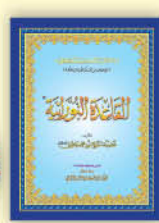
كتاب القاعدة النورانية A4 / A5