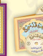
جزء قد سمع (معلم) سي دي صوت فقط