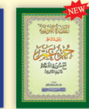
القاعدة النورانية وتطبيقها على جزء عمّ مع سورة الفاتحة تعليم المبتدئين