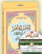
برنامج العشر الأخير بالصوت والصورة جزء عمّ وتبارك وقدمع