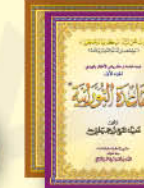
كتاب القاعدة النورانية خاص للأطفال الديق لايتسرق الجزء الأول / الجزء الثاني