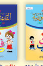
رحلة مع القاعدة النورانية من الألف إلى التاء (الجزء الثاني)